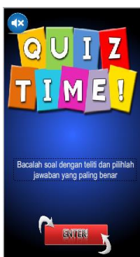
Gambar 5. Tampilan Kuis