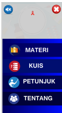
Gambar 3. Tampilan Menu utama