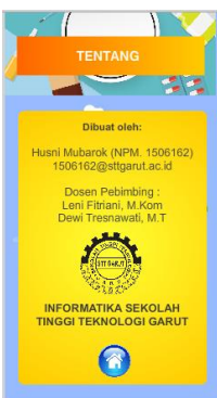
Gambar 7. Tampilan Tentang