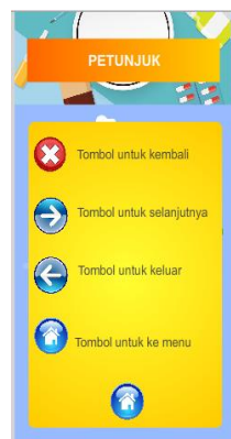
Gambar 6. Tampilan Petunjuk