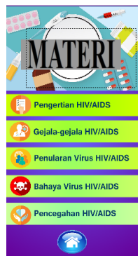
Gambar 4. Tampilan Materi